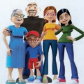
Um dia instituído para comemorar várias datas em um único momento especial de toda a família

No intuito de acompanhar essas transformações da sociedade e no ofício de educar, desde o ano passado a Casa Escola instituiu no seu calendário o “Dia da Família”. Em respeito às diferentes estruturas familiares, a escola optou por concentrar as datas do “Dia dos Pais” e “Dia das Mães”, em uma só, celebrada em toda a escola após a Semana da Poesia, na se-