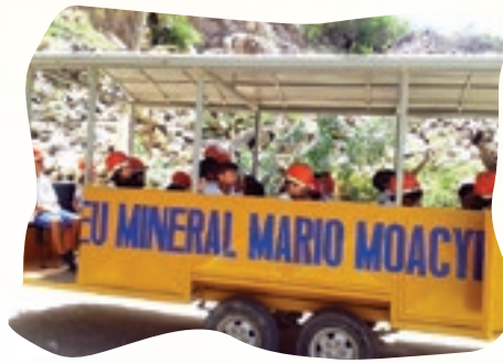
A visita à Mina Brejuí foi um dos momentos marcantes da viagem