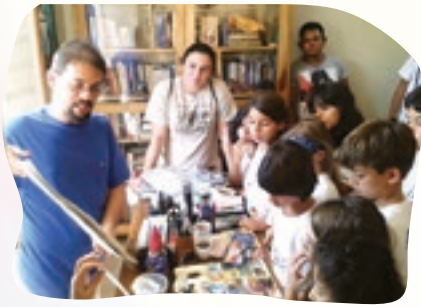
Os alunos tiveram a oportunidade de conhecer técnicas de pintura utilizadas pelo artista potiguar Assis Costa