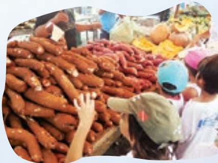
Os vários elementos da cultura potiguar foram vistos pessoalmente na feira

Os cheiros, as cores, as texturas e os diferentes produtos expostos em uma feira livre traduzem a cultura da nossa terra. Por esse motivo, os alunos dos Grupos IV e V visitaram o mercado de rua em busca de conhecer pessoalmente vários elementos da cultura potiguar estudados em sala de aula. O Grupo V vespertino, por exemplo, foi até a feira do Carrasco no bairro das Quintas, onde as crianças ficaram surpresas com a diferença do local em relação aos supermercados. “Achei a feira muito legal. O que eu mais gostei foi a parte de artesanato, principalmente das peças feitas de madeira. Meus amigos também gostaram muito