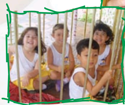
Os alunos quiseram entrar na caixa de mágica gradeada para experimentar como era a vida dos animais que viviam presos em jaulas de circo