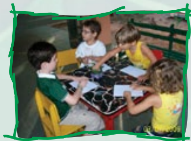
Desenho no Parque das Dunas