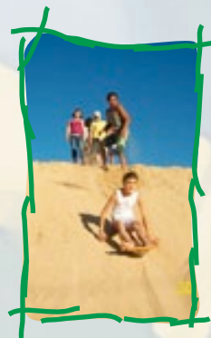
O esquiabunda é uma das diversões da Colônia de Férias

É para deixar o recesso escolar ainda mais divertido, em um ambiente criativo e lúdico que, no dia 21 de junho, será iniciada nossa Colônia de Férias. Muitas brincadeiras e passeios já estão programados, além de vídeos, jogos, esportes, oficinas de arte, música, culinária e expressão corporal. A Colônia acontecerá no período vespertino, das 13h30 às 17h30, em dia de jogo do Brasil à tarde, a programação será antecipada para ser das 7h30 às 11h30. A Colônia de Férias da Casa Escola é aberta a toda criança entre 03 e 12 anos de idade, conta com pacotes diários e semanais e será encerrada no dia 02 de julho.