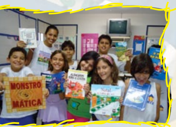
A leitura passou a ser um momento prazeroso para os alunos do 4º ano.

"O resultado não se resume no despertar da leitura, trabalhamos a oralidade e ao final de cada ciranda o aluno faz a resenha do livro que mais gostou. A partir daí, treinamos a pontuação, as convenções textuais e o vocabulário", preconiza Kézia.